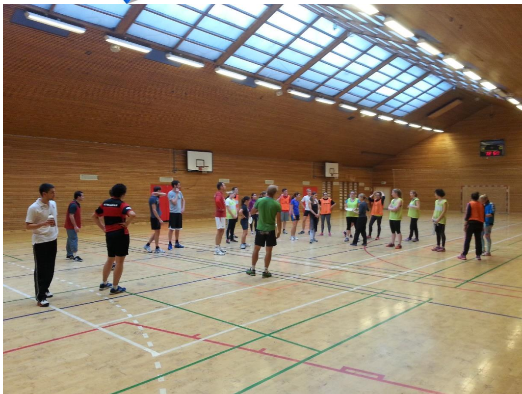
Ultimate Frisbie játék (3. nap)